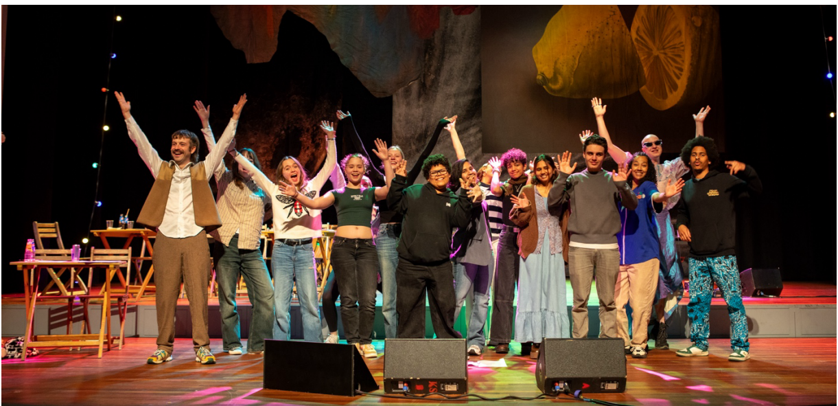
Poeziebar XS

Het geven en organiseren van workshops op scholen en houden van een apart scholieren evenement bleek echter belastend voor onze organisatie en vroeg te veel tijd onze andere plannen. Vanaf 2026 blijven we wel de jonge dichters uitnodigen voor de Poeziebar en kunnen jonge dichters die workshops hebben gevolgd bij Huis van Gedichten voordragen voorafgaande aan de Poeziebar XL .